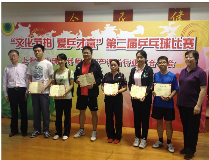
(图为比赛颁奖现场)

在此也预祝其他参赛人员再接再厉，锻炼好身体，保持良好的精神状态，努力为我们瑞和会计师事务所多做贡献！